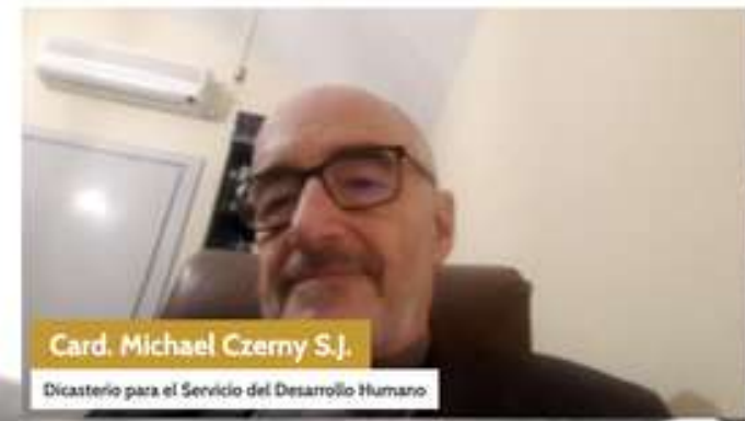
Card. Michael Czerny S.J.

Dicasterio para el Servicio del Desarrollo Humano